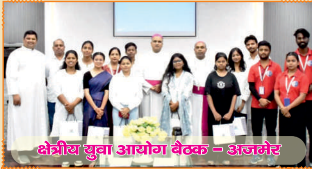
क्षेत्रीय युवा आयोग बैठक - अजमेर