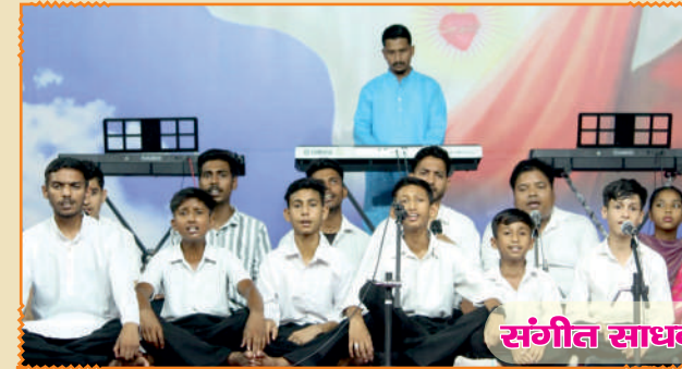
संगीत साधना - सितारगंज