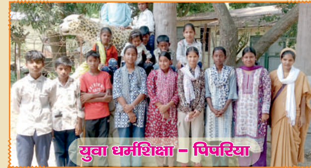
युवा धर्मशिक्षा - पिपरिया