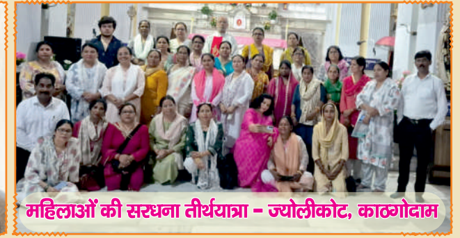
महिलाओं की सरधना तीर्थयात्रा - ज्योलीकोट, काठगोदाम