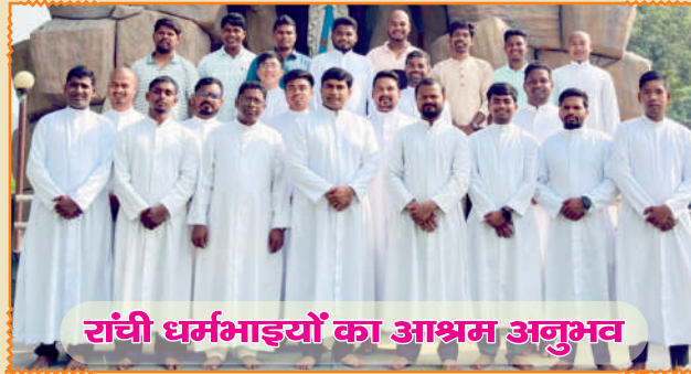
रांची धर्मभाइयों का आश्रम अनुभव