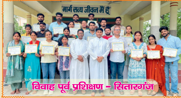
विवाह पूर्व प्रशिक्षण - सितारगंज