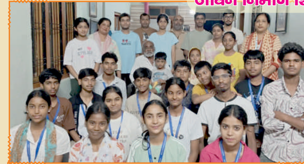
जीवन निर्माण शिविर, 2026 - किच्छा

“ Speak, Lord, your servant is listening. ” 1 Samuel 3:10