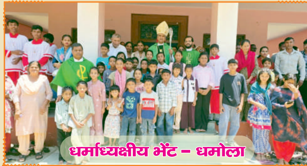
धर्माध्यक्षीय भेंट - धमोला