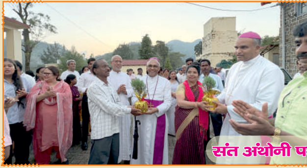
संत अंथोनी पर्व - ज्योलीकोट