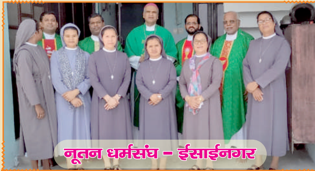
नूतन धर्मसंघ - ईसाईनगर