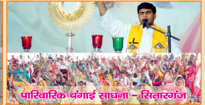
पारिवारिक चंगाई साधना - सितारगंज