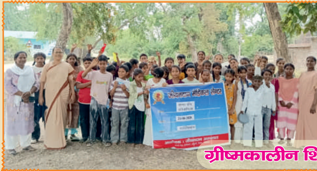
शीघ्रकालीन शिविर - मोतीनगर